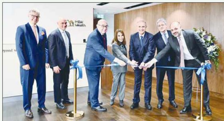
NBK Wealth opens upgraded London office for elite clients.

NBK Wealth remains steadfast in its dedication to fostering strong relationships with its clients in Ku-