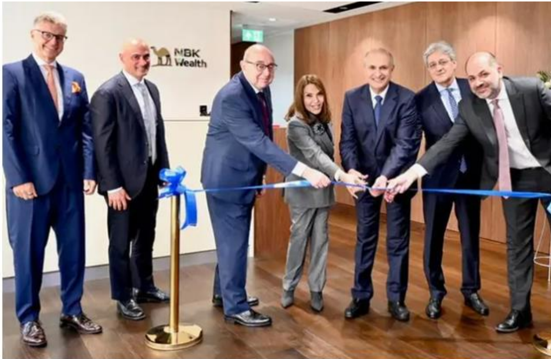
NBK Wealth Group new London office official opening ceremony.