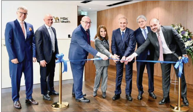
لمقر والبحر مع قيادات البنك «الوطني للثروات»، خلال قص شريط الافتتاح

حجم الأصول المالية الشخصية تجاوز 41 مليار دولار بنهاية 2024