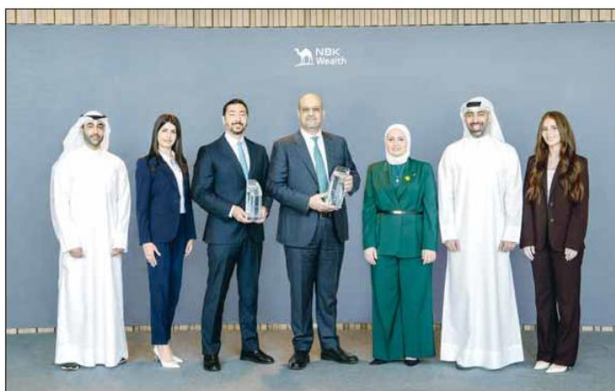
Euromoney crowns NBK Wealth best for fixed income in 2026.

Furthermore, these awards demonstrate the strength of the NBK Wealth Group brand, which is the largest wealth management group locally and one of the largest regionally, whose strength stems from the regionally and internationally leading NBK Group, as the latter maintains a long history of achievements and international awards in recogni-