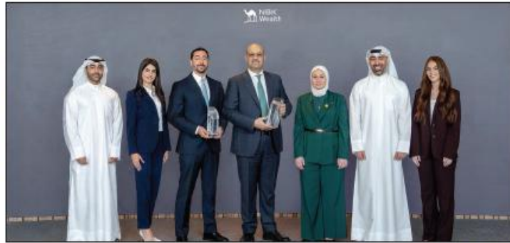
لقطة جماعية خلال تسلم الجائزتين

الفوز يعكس سعي الشركة لتحقيق أداء متميز لعملائها وحلول استثمارية مبتكرة