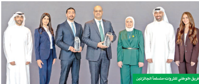
فريق «الوطني للثروات» متسلماً للجائزتين

على فهم الأهداف المالية الفريدة لكل عميل، وتصميم استراتيجيات مخصصة تسعى إلى تحقيق أقصى عائد ممكن مع إدارة المخاطر بفعالية. تجدر الإشارة إلى أن «الوطني للثروات» هي علامة مسجلة باسم بنك الكويت الوطني ش.م.ك.ع. لاستخدامها في خدمات إدارة الأصول التي يتم تقديمها، على مستوى العالم، من شركة الوطني للاستثمار ش.م.ك.م. وهي شركة استثمار رائدة والشركات التابعة لها (وشركات أخرى تابعة للمجموعة)، إلى جانب الخدمات المصرفية الخاصة المقدمة على مستوى العالم من بنك الكويت الوطني وهو أحد أكبر وأقدم المؤسسات المالية في المنطقة.