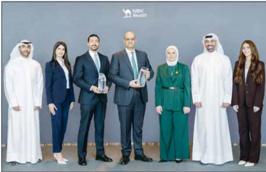
فريق "الوطني للثروات" يتسلم الجوائز

وأوضح البيان ان الجوائز تدبرن على قوة العلامة التجارية لمجموعة "الوطني للثروات" حيث تستمد قوتها من اسم وعلامة مجموعة بنك الكويت الوطني، والتي يحظى سجلها بتاريخ مفلح من الإنجازات والجوائز العالمية . وتتميز "الوطني للثروات" بقدرتها على فهم احتياجات العملاء المختلفة وابتكار إستراتيجية مضممة خصيصاً لتلبية احتياجات كل عميل، كما تقدم المجموعة مجموعة من المنتجات، مثل إستراتيجيات الدين الخاص، والودائع المهيكلية، وخدمات إدارة المحافظ المدارة من قبل لشخص المرخص له المتخصصة، إضافة إلى الخدمات المصرفية الخاصة الشاملة مثل إدارة الثروات، والتخطيط المالي، وإدارة الاستثمارات، والخدمات الاستشارية.