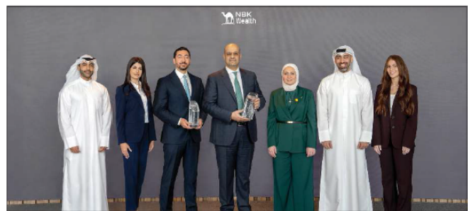
فريق مجموعة «الوطني للثروات»، خلال تسلمه جائزتي الأفضل في أدوات الدخل الثابت على مستوى الكويت والشرق الأوسط لعام 2026

■ الفوز يعكس سعي الشركة إلى تحقيق أداء متميز لعملائها وتوفير أدوات استثمارية موثوقة ■ الجائزة تبرهن اعتماد المجموعة على استراتيجيات تجمع بين التحليل للأسواق وإدارة المخاطر بكفاءة