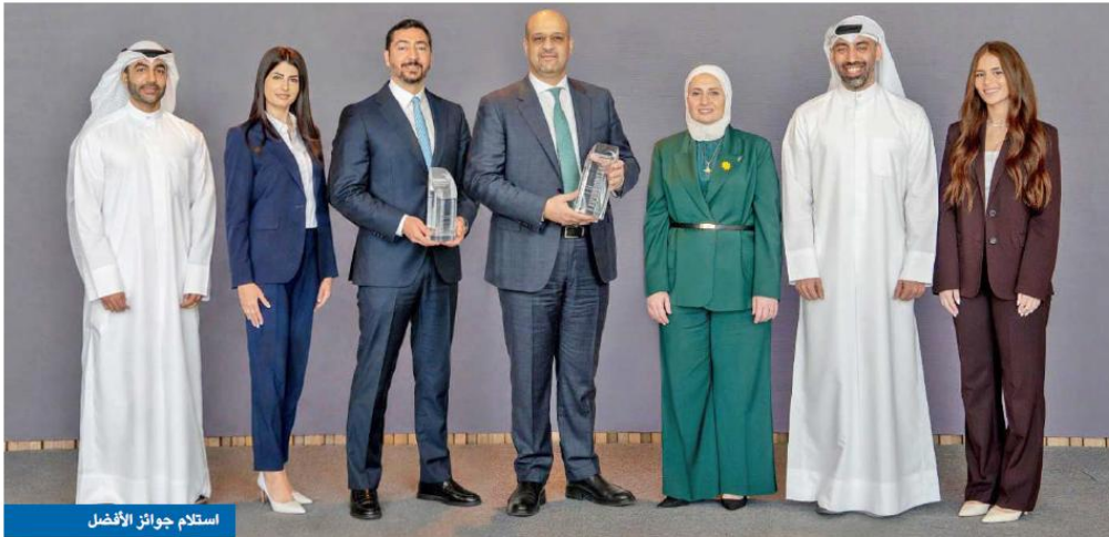
استلام جوائز الأفضل

1 فازت بجائزتي الأفضل في أدوات الدخل الثابت من «يوروموني»