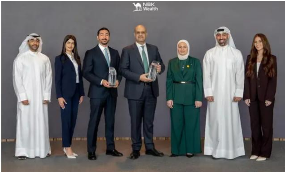
NBK Wealth, the region's leading wealth management group, has been awarded Euromoney's 2026 Best Fixed Income Provider Awards for Kuwait and the Middle East.