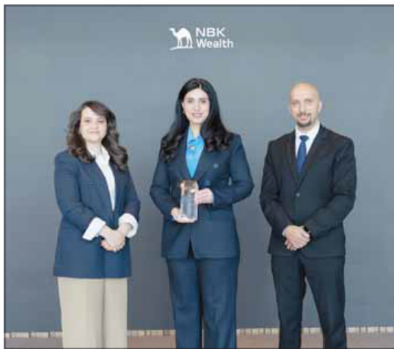
خلال تسلم الجائزة

في الأسواق المحلية والإقليمية والعالمية، كما تتميز بصمة جغرافية واسعة تمتد عبر 9 مدن في 5 دول مختلفة، تقدم من خلالها مجموعة شاملة من الخدمات. وتتبع المجموعة نهجا يركز على السعي على إيجاد الحلول المخصصة التي تتناسب مع الاحتياجات الفردية لكل عميل بما يلي الأهداف المالية الفريدة للأفراد والمؤسسات من ذوي الملاحة المالية العالية، كما تقدم مجموعة متكاملة من الخدمات المصرفية الخاصة وإدارة الثروات، بما في ذلك التخطيط المالي للثروات، وإدارة المحافظ الاستثمارية، والخدمات الاستشارية المتخصصة في مجالات مثل المكاتب العائلية، والعقارات، وإدارة النقد والائتمان، وكيانات الأمانة المالية الخارجية، والوصايا.