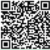
بيان إخلاء المسؤولية