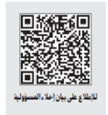
للاطلاع على بيان أداء الصندوق

للتوسع المستقر. وقد تزايد اهتمام المستثمرين بالأصول البديلة مع مرور الوقت في ظل مساعيهم لتحقيق عوائد أعلى وتنويع محافظهم، وفي بعض الحالات، الحماية من التضخم. ويعكس هذا الطلب المتزايد الدور المتنامي الذي تلعبه الأصول البديلة في استراتيجيات الاستثمار الحديثة.